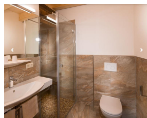
Zimmer- und Badbeispiele